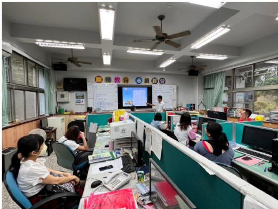
112 學年第學一期家庭教育會議