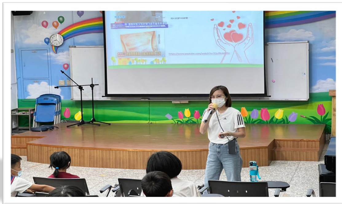
113/5/3 遠離家庭暴力，營造安全與尊重的成長環境。