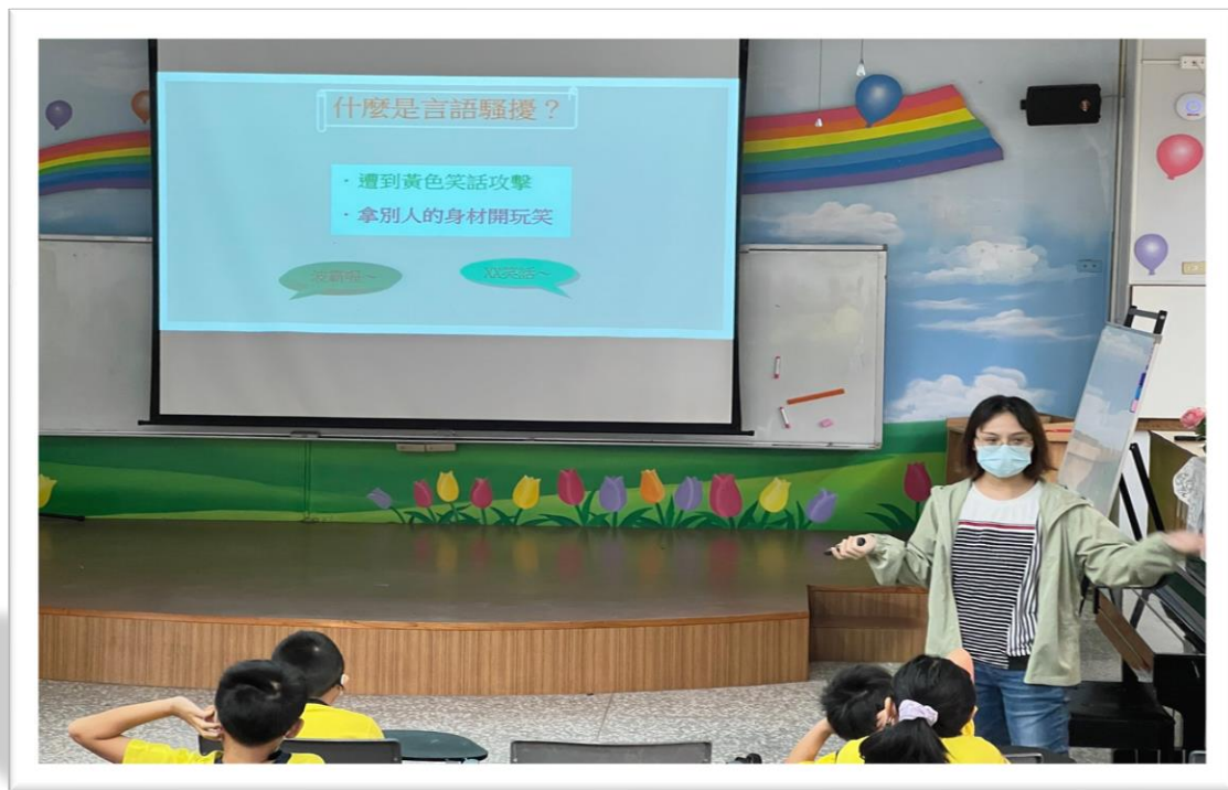
112/12/22 家庭親子共學共同促進成長