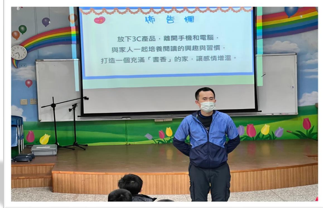
113/2/23 善用3C產品尊重兒童權利， 創造健康成長環境