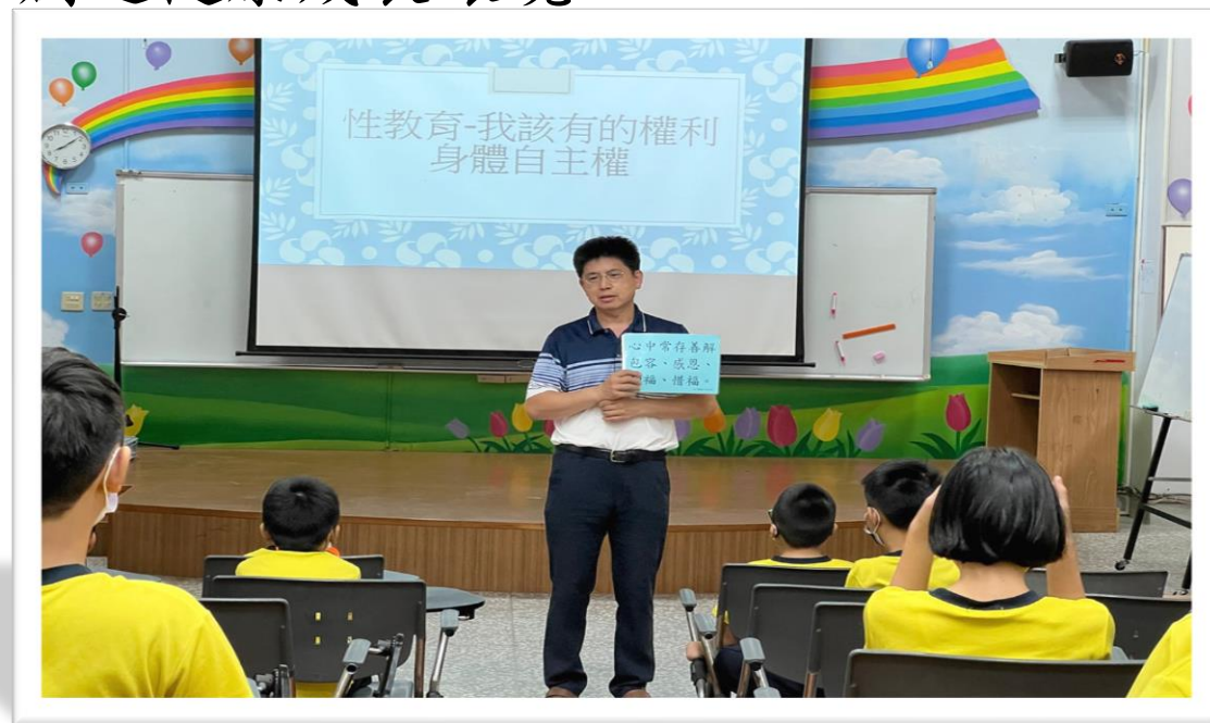
112/9/28 家庭教育宣導-身體自主權